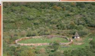
En el valle de Pinzón, en el enclave de La Brañuela, se ha reconstruido un chozo de horma con techumbre de escobas y, a su lado, el amplio corral en el que se recogían las ovejas.

al Puerto de Las Señadas Zona de Reserva del Pinar de Lillo