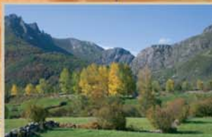
La Hoz de Entrevados, con su roquedo negruzco, se intuye al final de la hermosa vega de Cofiñal en la que confluyen el río de Isoba y el Porma.