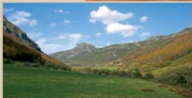
El valle de Pinzón muestra el característico perfil en U de los valles modelados por el hielo de los glaciares.