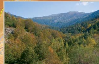
El Pinar de Lillo constituye una de las áreas más valiosas y singulares del Parque Regional, por lo que ha sido protegida bajo la figura de Zona de Reserva. Se trata de un pinar autóctono de pino silvestre, uno de los contados bosques de este tipo que han sobrevivido a los últimos milenios en la Cordillera Cantábrica.

al Puerto de Las Señadas Zona de Reserva del Pinar de Lillo