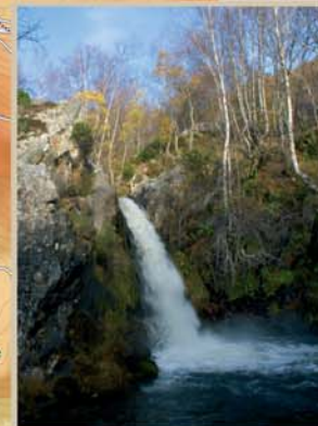
En el paraje de los Forfogones tres rugientes cascadas se suceden en un corto tramo del recién nacido río Porma.