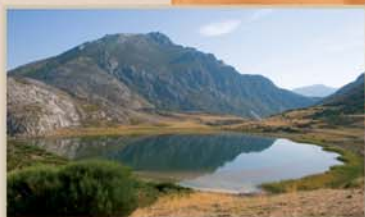
Desde el pueblo de Isoba, una variante de la ruta señalizada con el código PR-LE 27.1 permite acceder al lago de Isoba, donde coincide con el PR-LE 17 que conecta el lago con Puebla de Lillo.